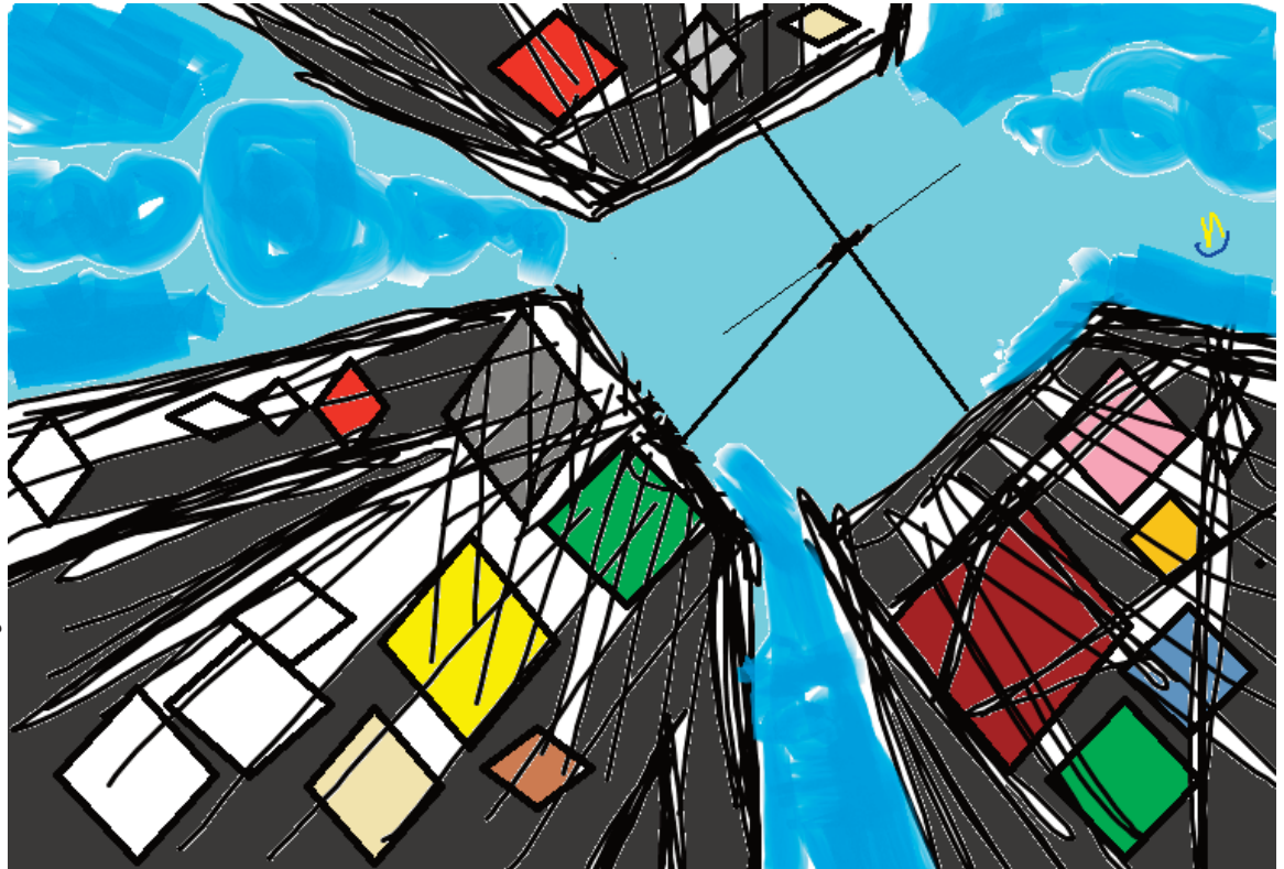
illustrazione di Zaira D'Agata