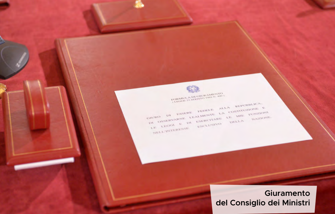
Giuramento del Consiglio dei Ministri