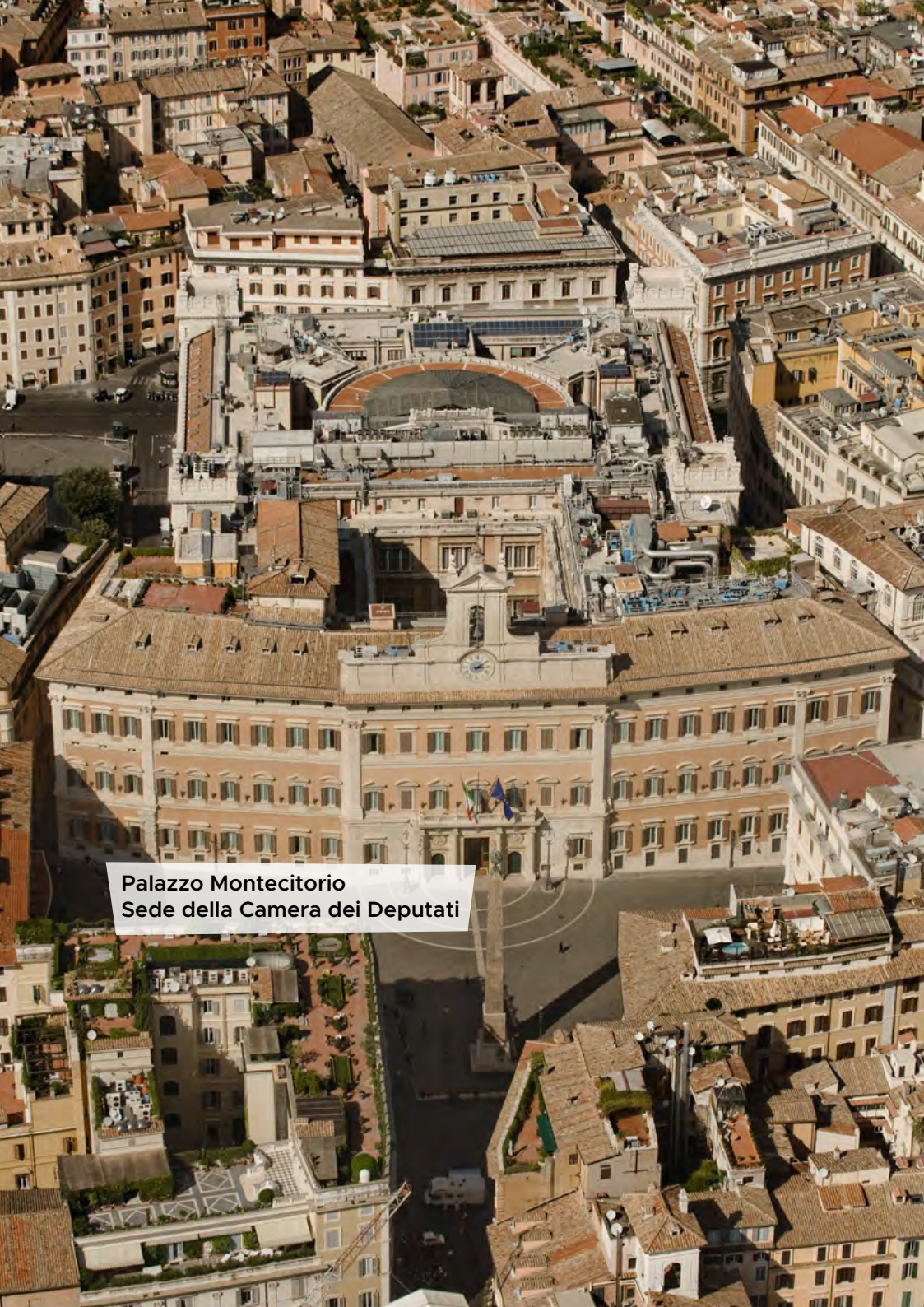
Palazzo Montecitorio Sede della Camera dei Deputati