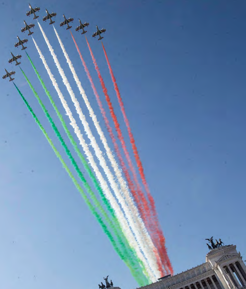
Altare della Patria Roma