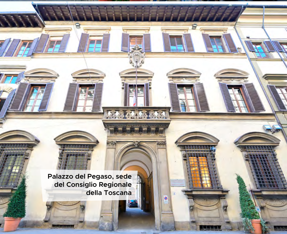
Palazzo del Pegaso, sede del Consiglio Regionale della Toscana