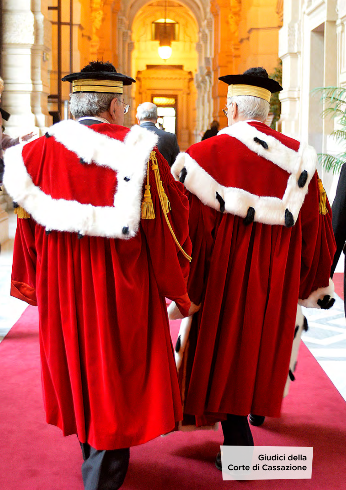
Giudici della Corte di Cassazione