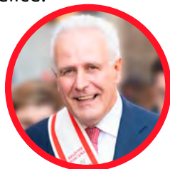
Eugenio Giani Presidente della Regione Toscana

Per portarci in un paese che la nostra Costituzione vuole più giusto e felice.