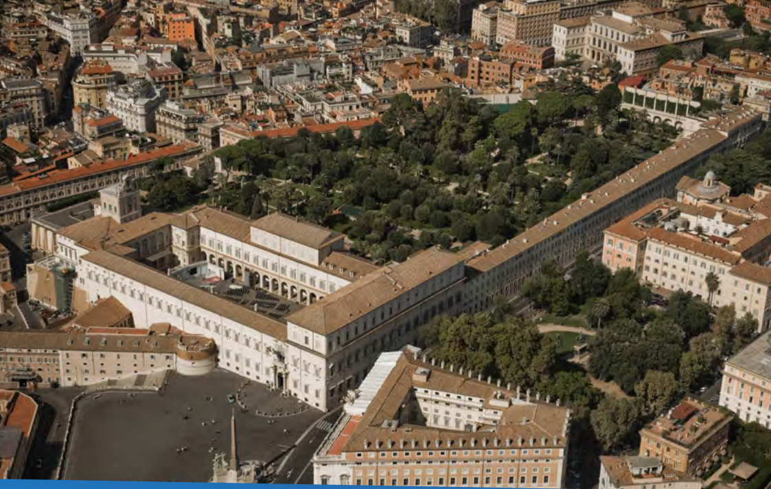
Palazzo del Quirinale Sede della Presidenza della Repubblica