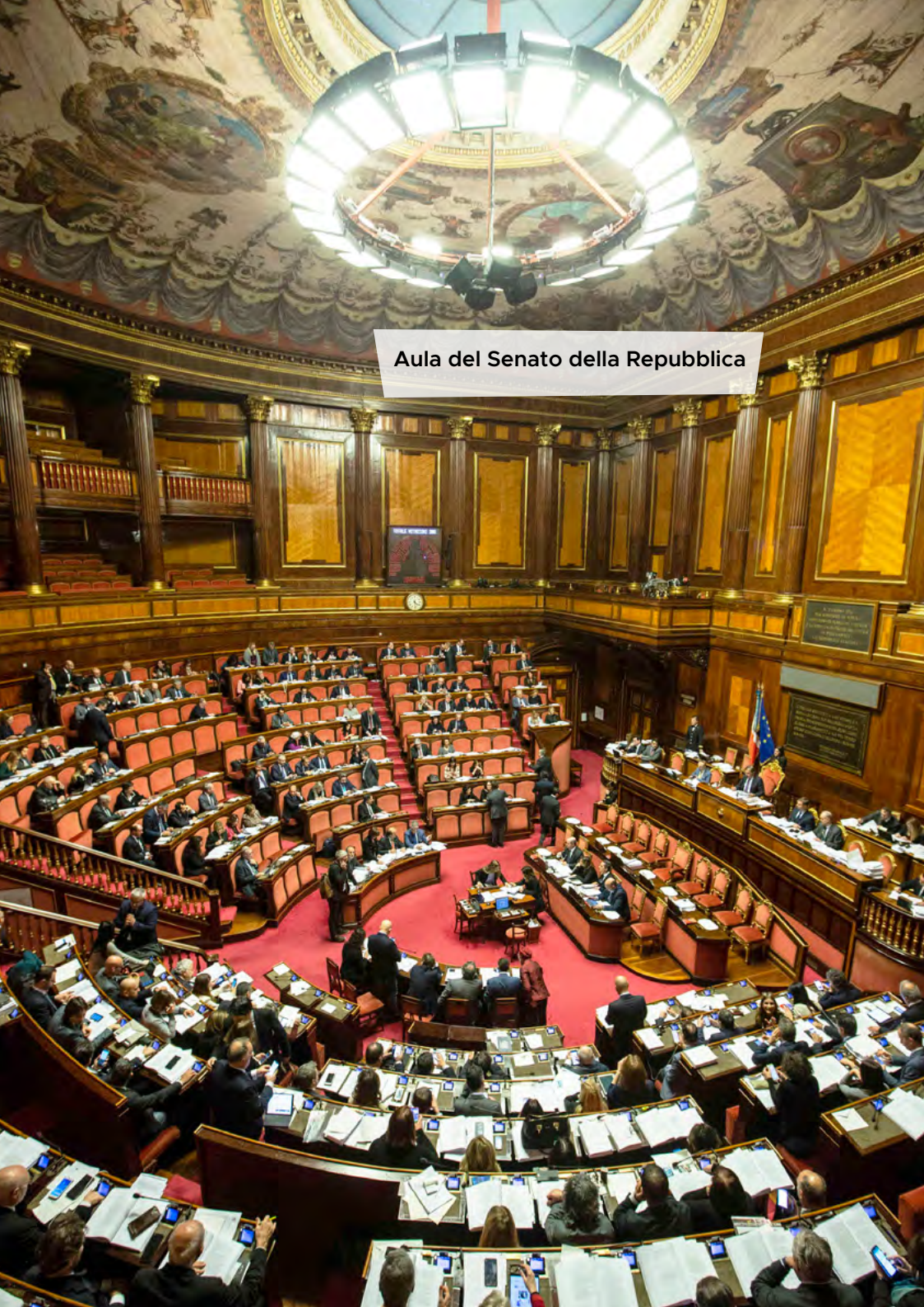
Aula del Senato della Repubblica