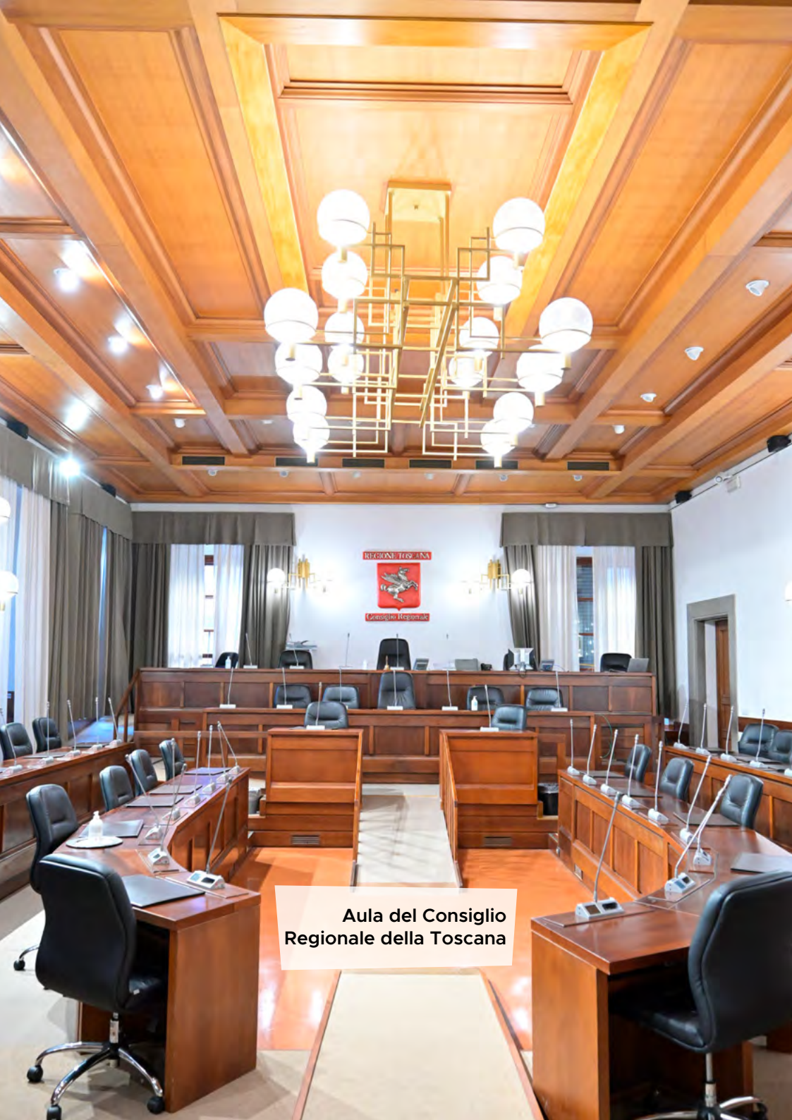
Aula del Consiglio Regionale della Toscana