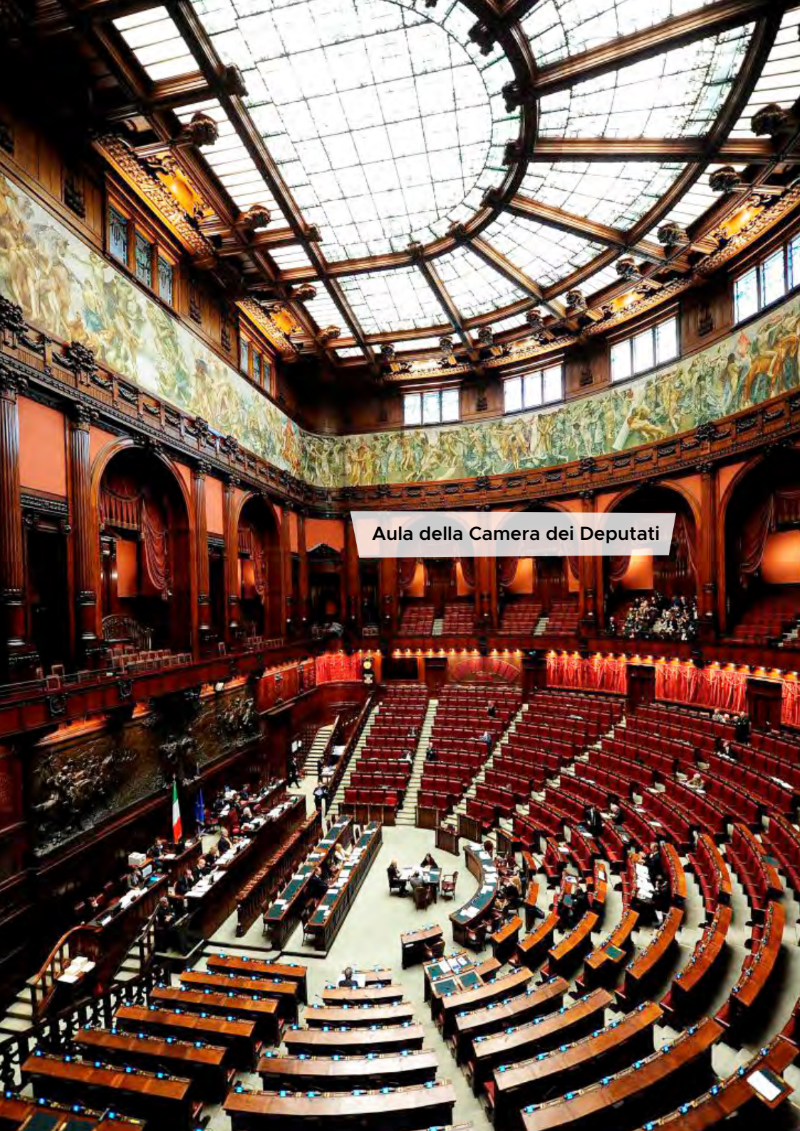
Aula della Camera dei Deputati