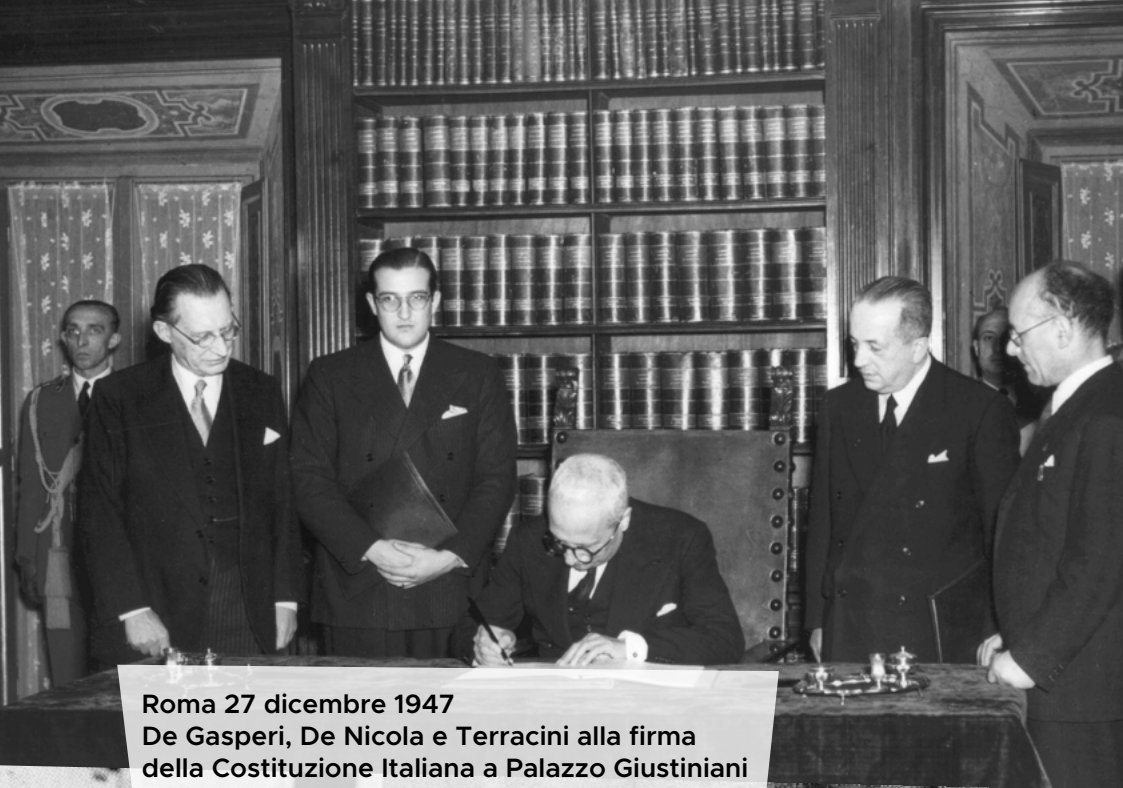
Roma 27 dicembre 1947 De Gasperi, De Nicola e Terracini alla firma della Costituzione Italiana a Palazzo Giustiniani