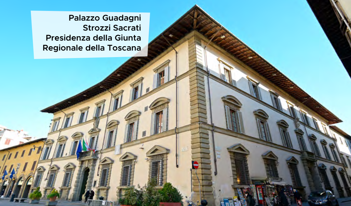
Palazzo Guadagni Strozzi Sacratì Presidenza della Giunta Regionale della Toscana